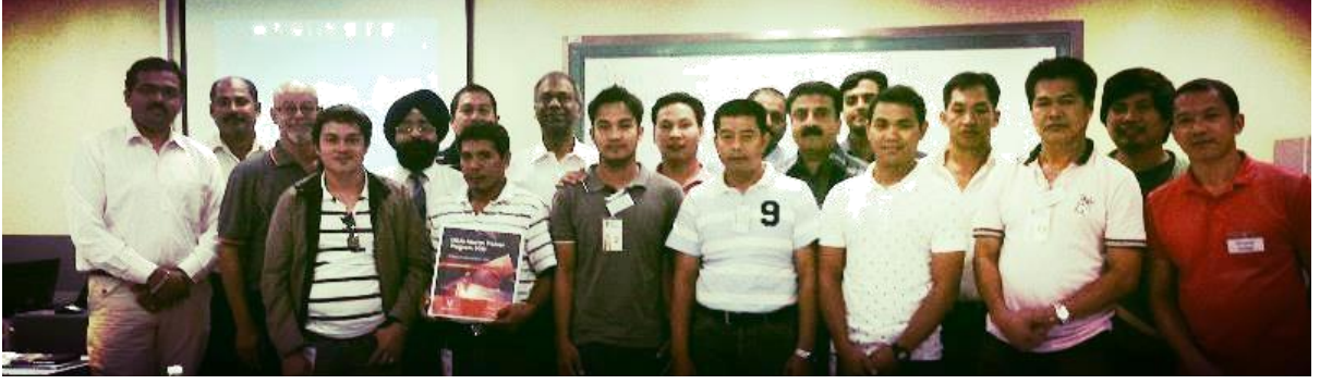
प्रतिभागियों, वेतस्सेस्स ट्रेनर्स और सीनियर मनगेर्स की इक्कठे तस्वीर